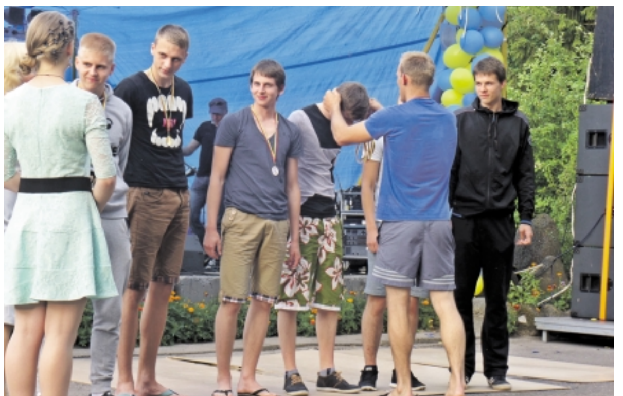
Akimirka iš Pašyšių kaimo šventės „Susirinkime visi“.

Šventės organizatoriai džiaugėsi, kad šventinę dieną ryškiai suspindusi saulė nepagailėjo šilumos. Dėl puikaus oro šventės dalyvių nuotaika buvo tik dar geresnė. Susirinkusieji šėlo su hip hopo ritmu šokančia jaunimo grupe „Beast crew“ iš Šilutės, klausėsi vokalinio