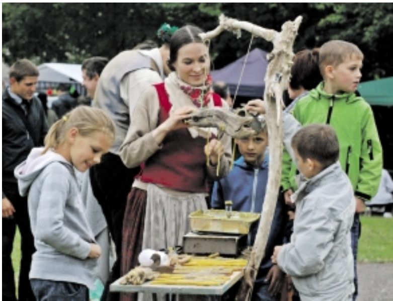
Norintieji galėjo pasimokyti, kaip žvakes išsilieti.