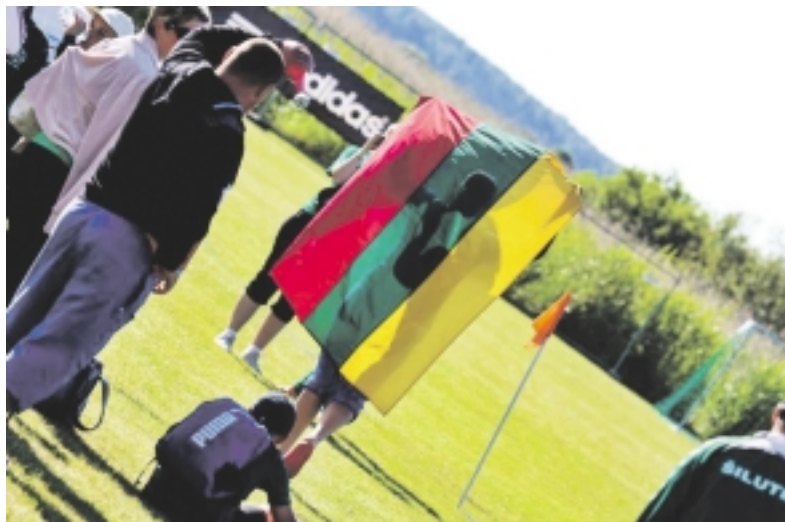
Lietuvai atstovavo keturios komandos - dvi iš Panevėžio ir dvi iš Šilutės.

VšĮ „Šilutės sportas“ vaikai tradiciškai, lydimi savo mokytojų ir tėvų, jau septynerius metus iš eilės savo amžiaus grupių Lietuvos čempionatuose futbolo sezoną užbaigia Estijoje, Parnu mieste. Tarptautinis futbolo turnyras sukviečia komandas iš Estijos, Suomijos, Latvijos, Švedijos, Vokietijos bei Lietuvos.