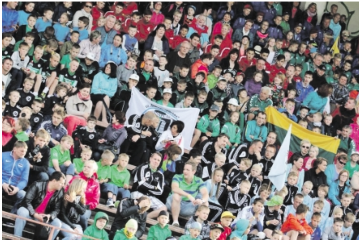
Tarptautinis turnyras Estijoje sukvietė 143 komandas iš įvairių šalių.

komanda sužaidė po šešias ar septynias varžybas, aplankė didžiulį vandens parką, turėjo galimybę maudytis jūroje, smagiai laiką leido atrakcionų parke, apsilankė miesto centre vykusioje šventėje „Hansa dienos”.