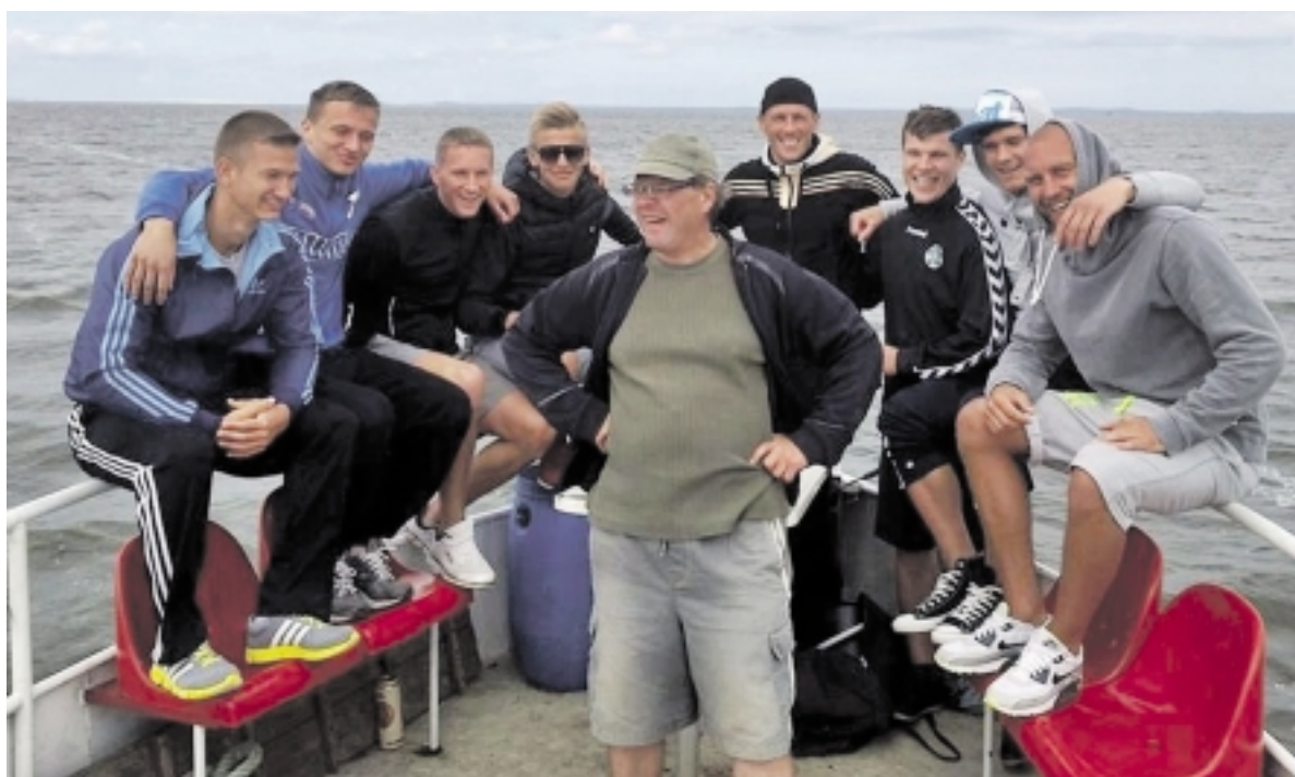
FK „Šilutė“ tradiciškai I rato pabaigtuves palydi laive.

Rezultatyviausias LFF I lygos XVIII turas, po sužaistų rungtynių, išlydėjo komandas į trumpas vasaros atostogas iki rugpjūčio mėnesio. Paskutinio turo susitikimuose Kauno „Stumbras“ (32 taškai), sostinės MRU (30 tšk.) ir Utenos „Utenis“ (27 tšk.) išsiskyrė su sirgaliais padovanodami įvarčių puokštę bei pakildami turnyrinėje lentelėje. Kazlų Rūdos „Šilo“ (29 tšk.) futbolininkai iškovojo kuklią pergalę, o Kėdainių „Nevėžis“ sužaidė lygiosiomis su „Šilute“ (12 tšk.).