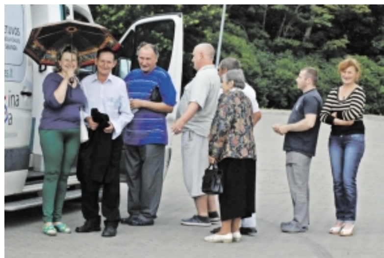
Anot medikų, joms linksmiausi pasirodė Stankiškių kaimo gyventojai, kurių net visa grupė atvažiavo į Ventę.