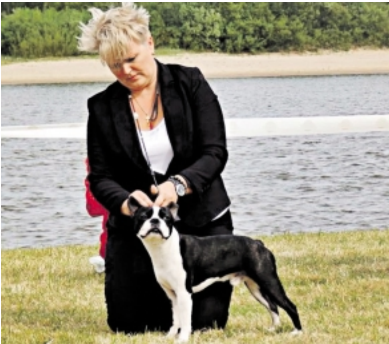
Taurė „Rusnės vasara 14“ atiteko Bostono terjerui Rus Ch Boston Style Gail Bi Back.

Šuo nuo amžių amžinųjų yra pelnęs geriausio žmogaus draugo vardą. Tai gyvūnas, kuris savo ištikimybę, meilę ir draugiškumu apdovanoja kiekvieną – ir didelį, ir mažą. Šuo yra ir sargas, ir draugas, ir vedlys, ir policininkas, ir ieškotojas. Esama ir šunų – grožio konkursų dalyvių. Birželio 28–29 dienomis Rusnės saloje, ant Atmatos upės kranto, vyko regioninė visų veislių šunų paroda.