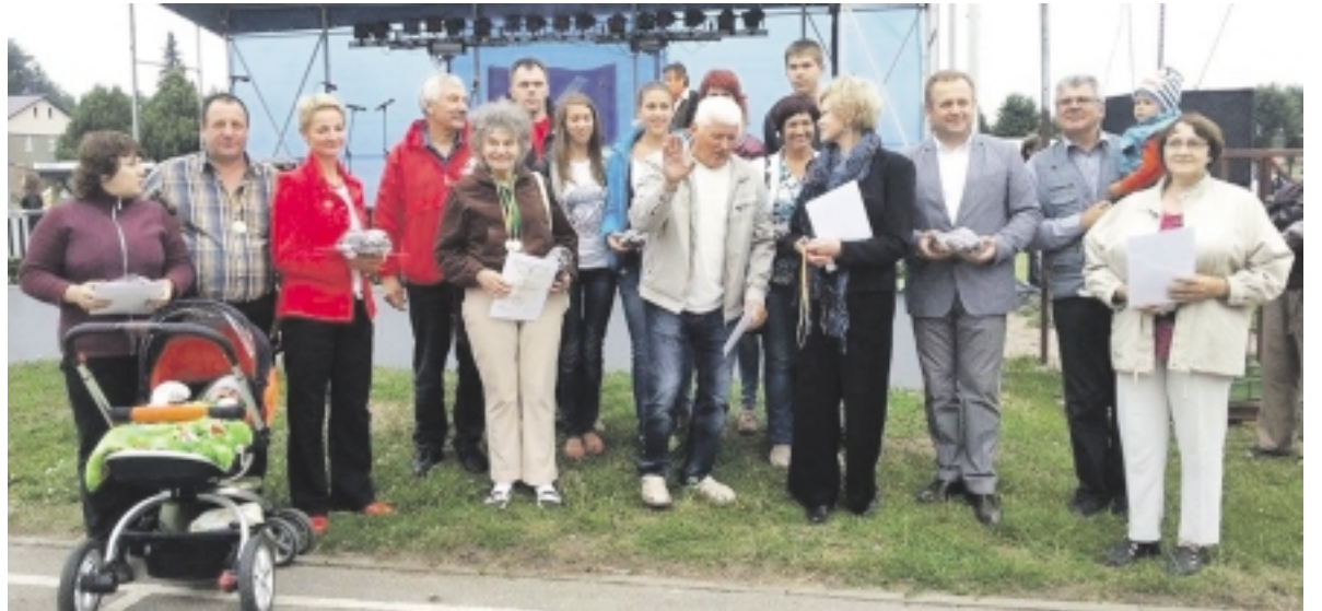
Nepamiršta apdovanoti aktyviausių saugiškių.

Savo jėgas buvo galima išbandyti ir šaškių žaidime, kur buvo galima