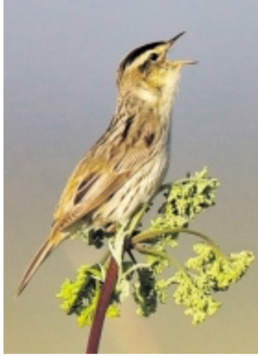
Dėl tokių dviejų valstybės saugomų paukščių - Meldinių nendrinukių - ūkininkei bandoma uždrausti šienauti 8,5 ha plote.

„Tai Jūs man pasakykite, kodėl aš - Lietuvos ūkininke - turinti tokią pat techniką, kaip ir „Goldengrass“, turiu atiduoti savo daug metų dirbtą žemę. Matote, aš juk puikiai prižiūrėjau savo sklypą ir du paukščiai čia apsigyveno. Ne-