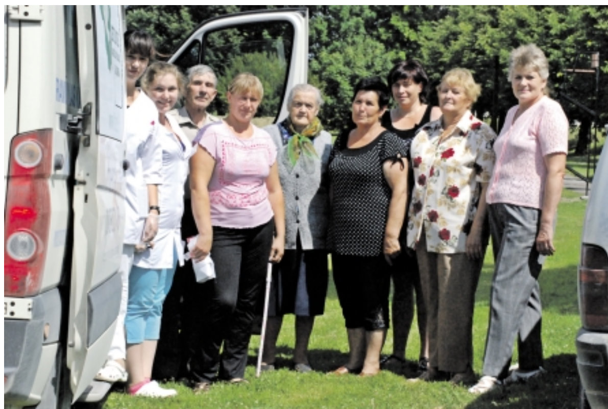
Šyliuose moterų buvo daugiau nei vyrų.