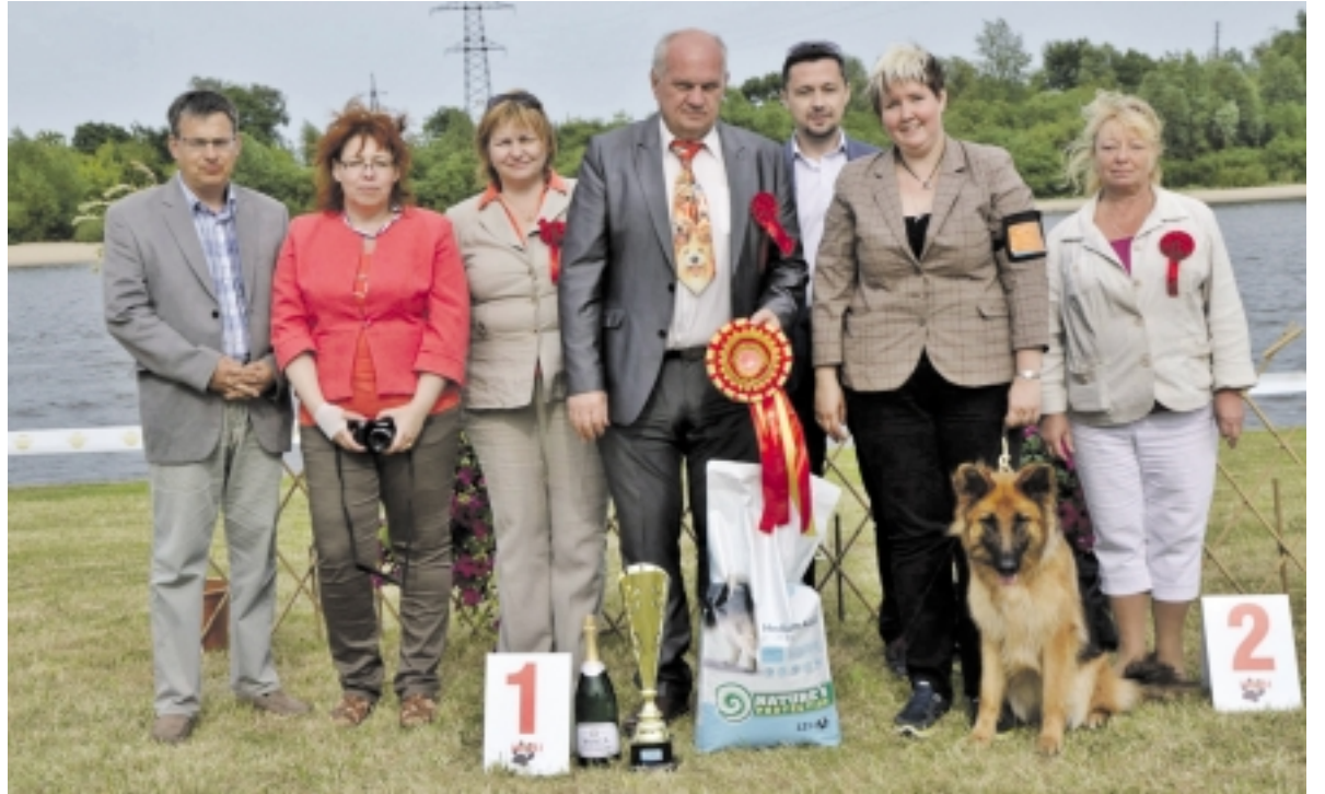
„Hobi 14“ taurės nugalėtoju pripažintas ilgaplaukis vokiečių aviganis Vita ad Astra Gloria.

Sekmadienį šunų augintojai bei jų „auklėtiniai“ varžėsi dėl taurės