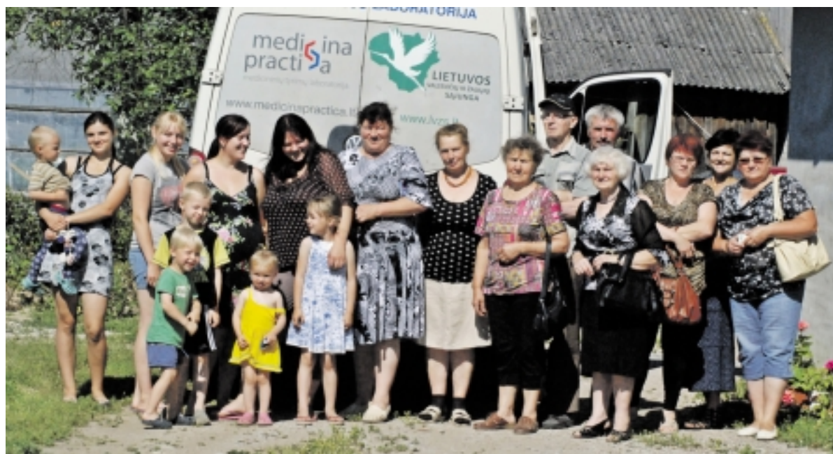
Itin linksmai nusiteikę mobiliosios diagnostinės laboratorijos laukė ramutiškiai.