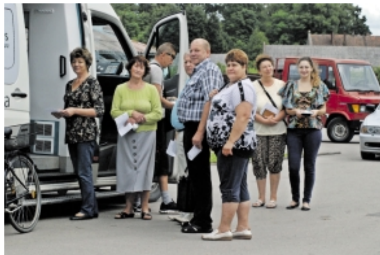
Saugiškiai noriai davė kraują tyrimams.