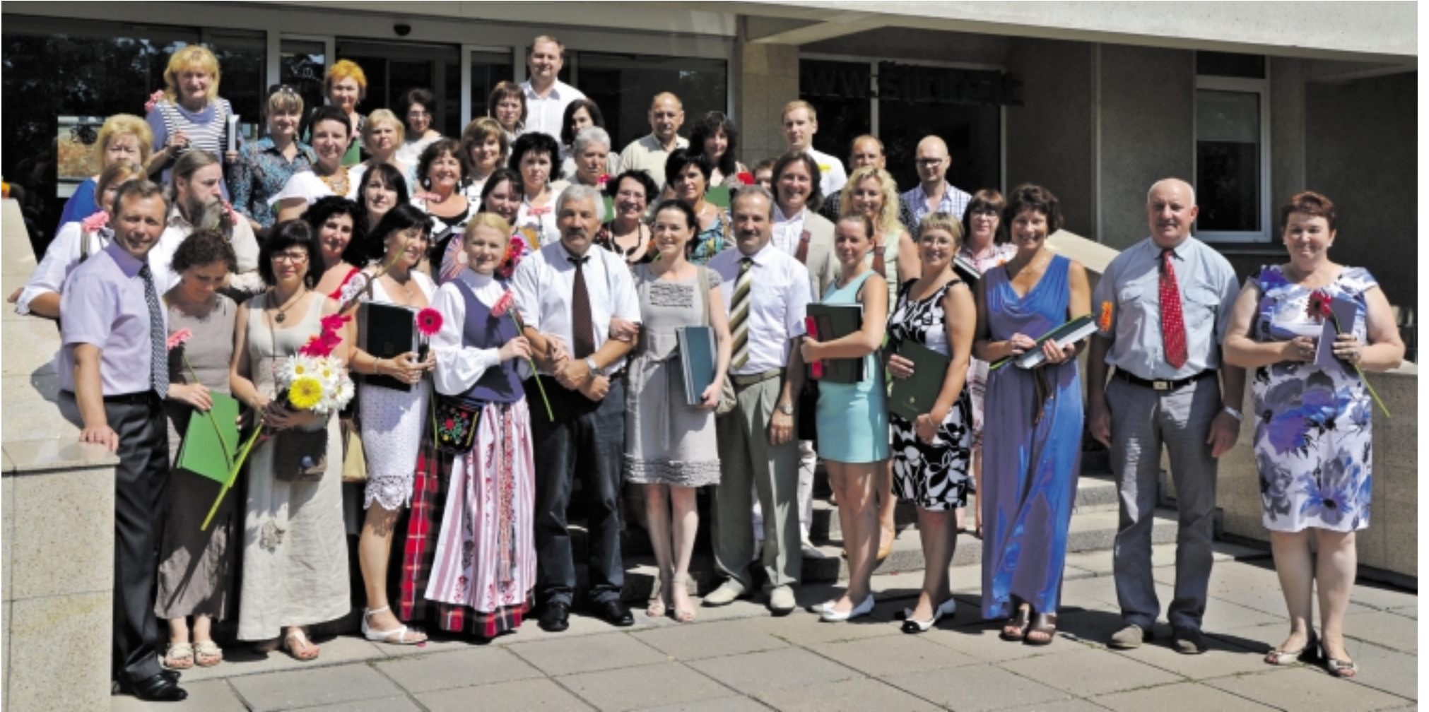
Po iškilmingos apdovanojimų ceremonijos visi nusifotografavo bendroje nuotraukoje.

Nors šiųmetės Dainų šventės „Čia – mano namai“ šurmuly jau nutilo, tačiau šimintinos šventės akimirkos dar ilgai išliks dalyvių širdyse. Nepamiršo puikiai Dainų šventėje pasirodžiusių rajono kolektyvų pagerbti ir Šilutės r. savivaldybės vadovai.