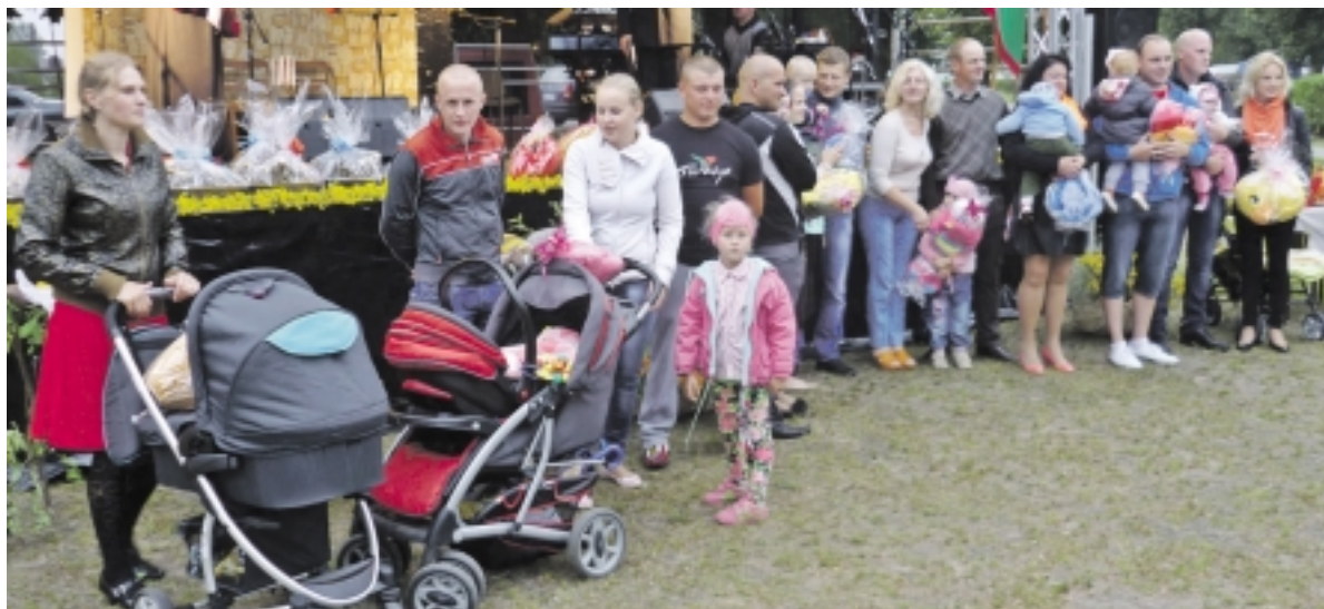
Pagerbtos šešios šeimos, auginančios tris ir daugiau vaikų.

UAB Tauragės regiono atliekų tvarkymo centras