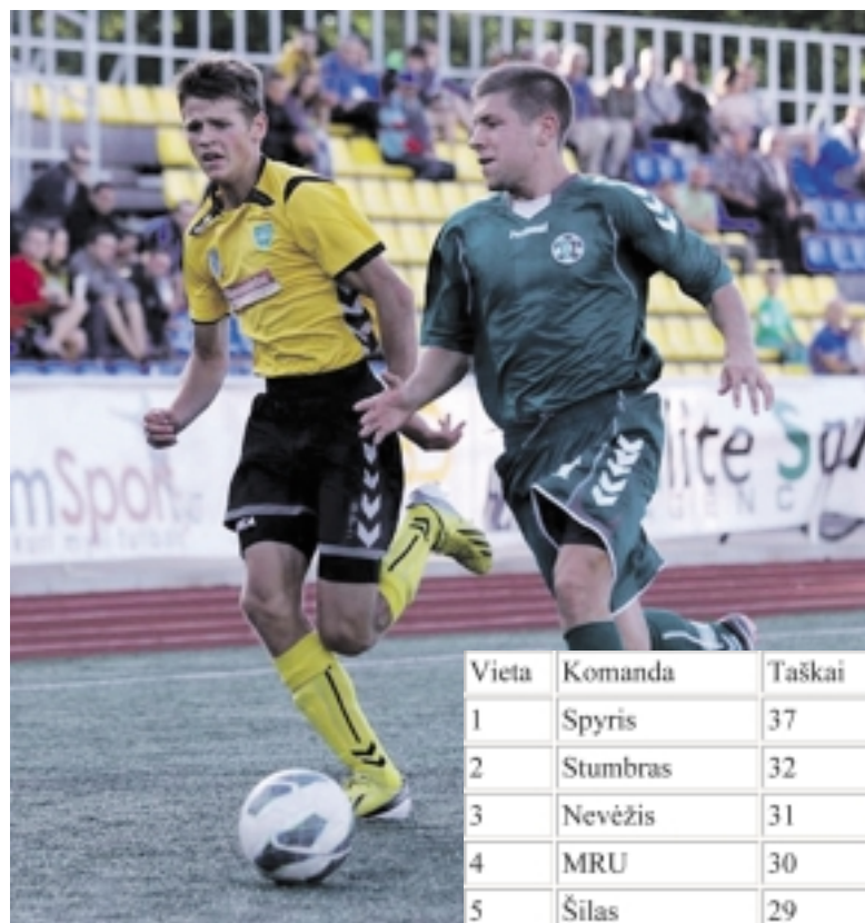
Akimirka iš susitikimo tarp „Baltijos“ ir „Šilutės“ vienuolių.

komandos kūrė progą po progos, tačiau nukreipti kamuolį į vartus ir susikurti puikią progą pergalei pritrūko tikslumo. XVIII ture „Nevėžis“ nukrito į trečią, o „Šilutė“ liko dešimtoje pirmenybių vietoje.