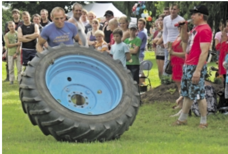
Pašyšiškiai turėjo galimybę išbandyti savo jėgas ir įvairiose rungtyse.