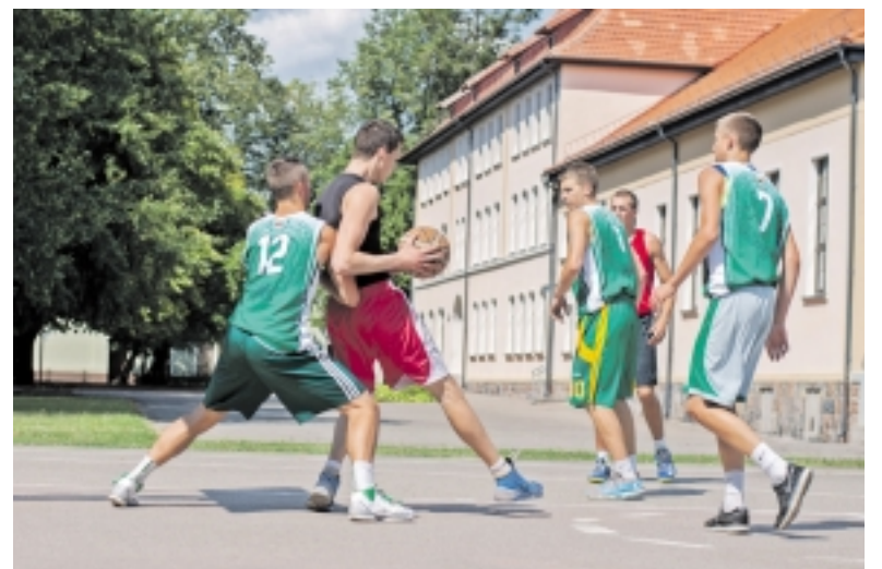
Įtempta finalinė kova.