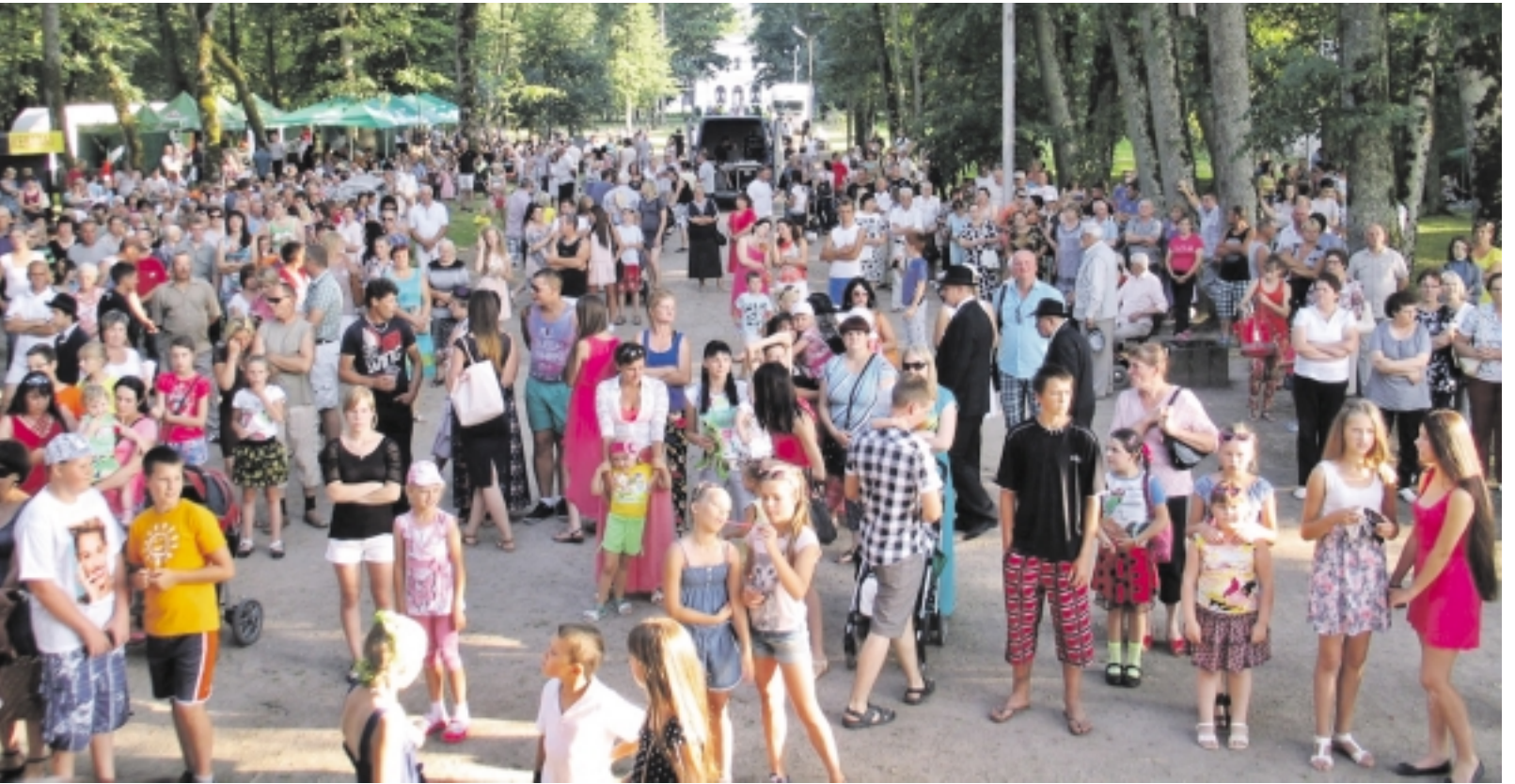
Nors sekmadienį ir buvo labai karšta, tačiau į savo šventę švėkšniškiai rinkosi noriai.

Tai buvo ypatingai žaisminga dalis, kurią pagyveno Švėkšnos neįgaliųjų draugijos narių surengta arbatėlė su vaisėmis. Išpūdingai atrodė ir jie patys, apsirėdę senoviais, geruosius dvaro laikus primenančiais rūbais. Šventinę dvaro aplinkos nuotaiką taip pat kūrė „Pamario Brass“ kvintetas iš Šilutės, kurio pūtikai grojo senuosius laikus primenančius kūrinius. Šią dalį pabaigė svečių iš Skaudvilės spektaklis, kurį šventės dalyviai buvo pakviesti žiūrėti į vietos verslininkų pastangomis gerokai atsinaujinusią „Genovefos vilą“.