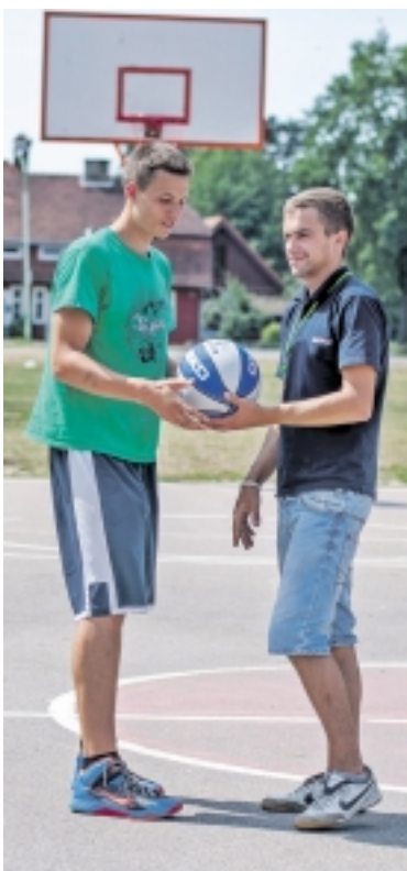
Turnyro metu organizuotas ne vienas konkursas, kuomet buvo galima laimėti rėmėjų dovanų.

Varžybos vyko pogrupiuose. Grupių etape stipriausia buvo E. Šaulio rinktinė „Draugai“, kurie įveikė iki tol laikytus turnyro favoritus „Rinktinius“, su broliais Jucikais. Iš kiekvienos grupės toliau keliavo po 3 komandas. Pirmąją vietą pogrupyje iškovojo komanda keliavo tiesiai į pusfinalį, o likusioms komandoms dar reikėjo pakovoti dėl vietos pusfinalyje. Pusfinaliuose susitiko „Pacanoji Rizikano“ su „Rinktiniai“ ir kitame pusfinalyje „Draugai“ su „Time Team“ komanda. Didžiausia staigmena, ko gero, įvyko, kai „Rinktiniai“ buvo eliminuoti pusfinalyje, o „Pacanoji Rizikano“ pateko į pusfinalį, kuriame susitiko su komanda „Draugai“. Finalas išties buvo vertas finalo vardo, kova vyko iki paskutinių sekundžių taškas į tašką, tačiau „Pacanoji Rizikano“ laimėjo rezultatu 20:17 ir iškovojo pagrindinį Šilutės miesto mero įsteigtą 500 Lt prizą, kurį pats ir įteikė. Čempionais tapo „Pacanoji rizikano“, sidabro medaliais pasipuošė „Draugai“, trečiąją vietą iškovojo „Rinktiniai“. Pertraukų metu žiūrovams organizuotas ne vienas konkursas, kuomet buvo puiki