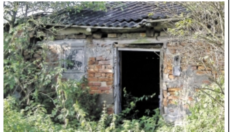
Netrukus jau ir šį tvartą, esantį Šereitlaukio kaime, Rambynų regioninio parko teritorijoje, teismas įteisins kaip bešeimininkį turtą ir perduos jį Pagėgių savivaldybei...

Daiktų, tarp jų ir statinių, pripažinimo bešeimininkiu turto procesas yra reglamentuotas LR civiliniame kodekse ir LR Vyriausybės 2004 m. gegužės 26 d. nutarimu patvirtintomis „Bešeimininkio, konfiskuoto, valstybės paveldėto, į valstybės pajamas perduoto turto, daiktinių įrodymų ir radinių perdavimo, apskaitymo, saugojimo, reali-