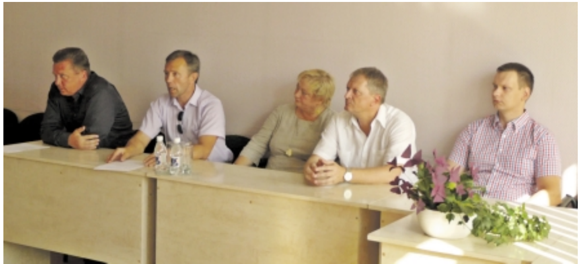
Naujai performuotos partijos Šilutės skyriaus aktyvas.