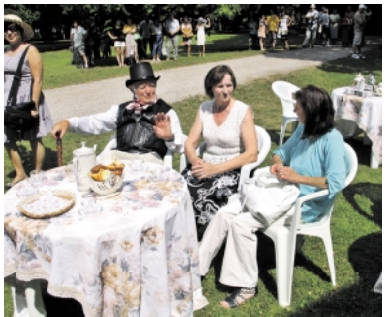
Švėkšnos neįgaliųjų draugijos atstovai buvo nuostabūs dvariškiai.