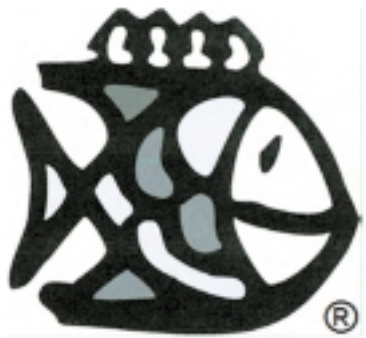
Oficialiai pripažintas Šilutės krašto ženklas.

Lietuvos Respublikos valstybinio patentų biuro 2014 m. birželio 25 d. oficialiame biuletenyje paskelbtas Šilutės rajono savivaldybės prekinis ženklas – Žuvis (408 psl.), liudijimo Nr. 68970.