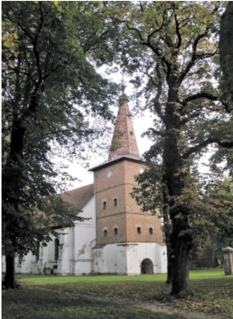
Rusnės bažnyčia net ir šiandien atrodo labai paslaptinga ir didinga.

Rusnės gyvenvietė iki pat 19 a. vidurio buvo antra didžiausia ir svarbiausia gyvenvietė Klaipėdos valsčiuje po Klaipėdos. Neabejotina, kad dar ordino laikais čia stovėta bažnyčios ir būta kunigo. 16–17 a. Rusnėje rezidavo Klaipėdos vyriausio valdytojo, vad. hauptammono reikalų patikėtinis amtmannas, vėliau vadintas burggrafu. Krašto bažnytinėje srityje Rusnė išliko svarbiu centru iki pat 19 a. antros pusės, dėl bažnytinių misijos, kuri sklido iš Rusnės, 16–17 a. buvo įkurtos kaimyninės Verdainės (Šilutės), Karklės, Šakūnų parapijos. Pastarosios ilgą laiką po to buvo dukterinės Rusnės parapijos arba filijos. 1832 m. Rusnėje, o ne Šilutėje, buvo įsteigta superintend-