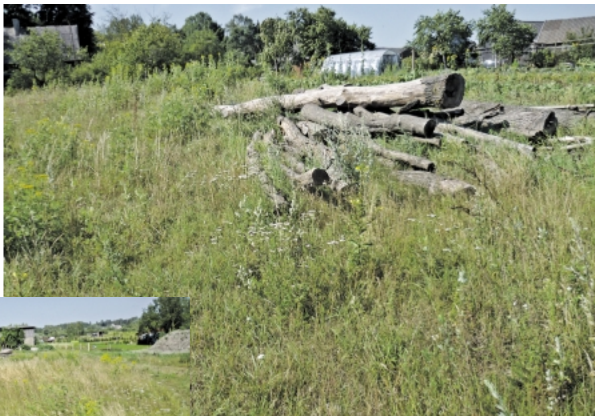
Riboženkliai – unikalūs, sklypas nešienaujamas...

„Tikrai ne, nesąmonė. Nei padangas deginau, nei baudą gavau“,