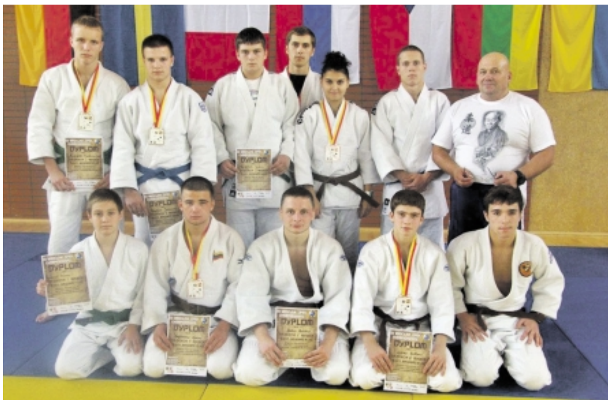
Akimirkos iš varžybų.

Gyvenime jam labai svarbus dziudo moralės kodekso laikymasis. Čia laikomos aukštesnėmis vertybėmis: mandagumas, dvasia, nuširdumas, savitvarda, garbė, kuklumas, draugystė, pagarba. „Visuomet stengiuosi su žmonėmis elgtis taip, kaip noriu, kad elgtųsi su manimi“, - išdavė sportininkas, kuris