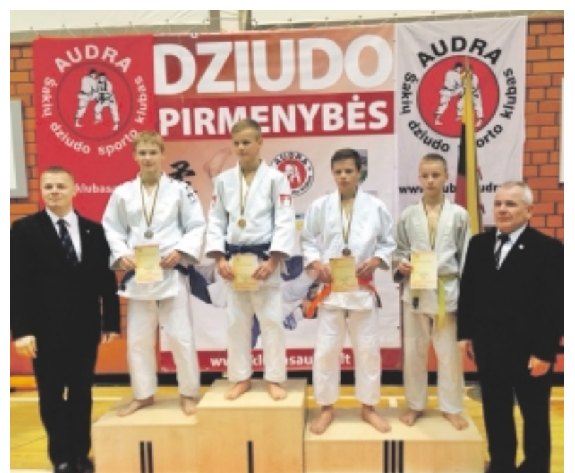
Lietuvos mokinių dziudo imtynių pirmenybių prizinininkai.