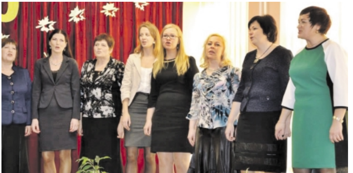
Bendrą dainą atliko visas įstaigos kolektyvas.