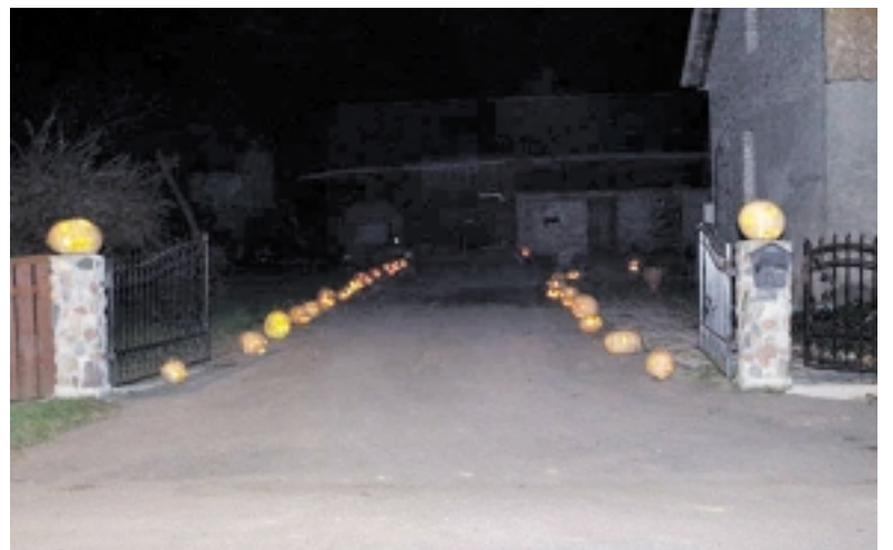
Vitos ir Tomo Girdvainių sodyba spalio 31-osios vakarą buvo apšviesta ypatinga moliūgų-žibintų šviesa.

Vita pasakojo, kad vyriausioji dukra, šiuo metu besimokanti 5-oje klasėje, pirmoji pademonstravo moliūgų pjaustymo ypatumus. „Ji tai buvo dariusi mokykloje, to-