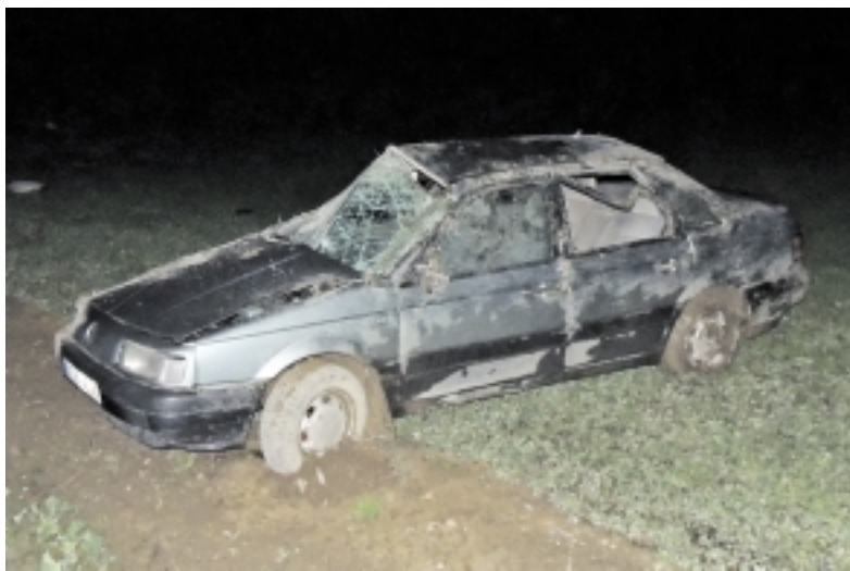
Šioje avarijoje automobilio prispaustas žuvo 45 metų vyriškis. rūko. Degusiame bute ugniagesiai rado vos gyvą katina, o iš kitame bute buvusių kelių kačiukų tik vienas teišgyveno.

Gaisro metu išdegė vienas kambarys, kitas kambarys ir virtuvė ap-