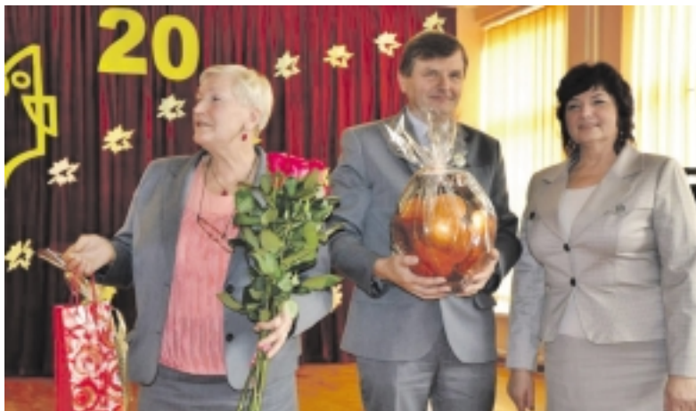
Tą dieną sveikinančiųjų netrūko. Dovanas įteikė ir Žemaičių Naumiesčio gimnazijos direktorius bei direktoriaus pavaduotoja.

Šventinis šurmulyš dar ilgai netilo. Mokyklos-darželio direktorė ir meras kieme pasodino Sibiro egles sodinuką, o susirinkusieji skanavo šventinį tortą ir dalijosi prisiminimais.