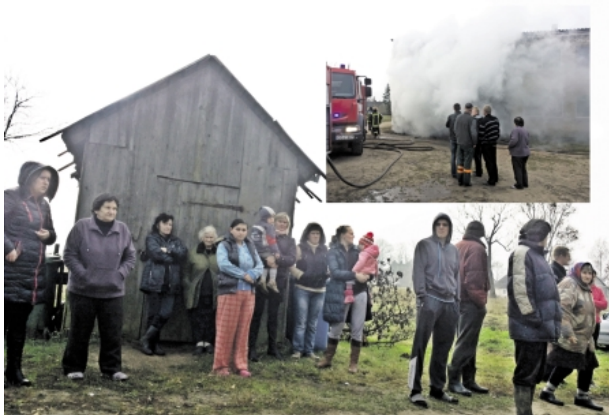
Usėnų seniūnijoje, Kavolių kaime, užsidegė daugiabutis.