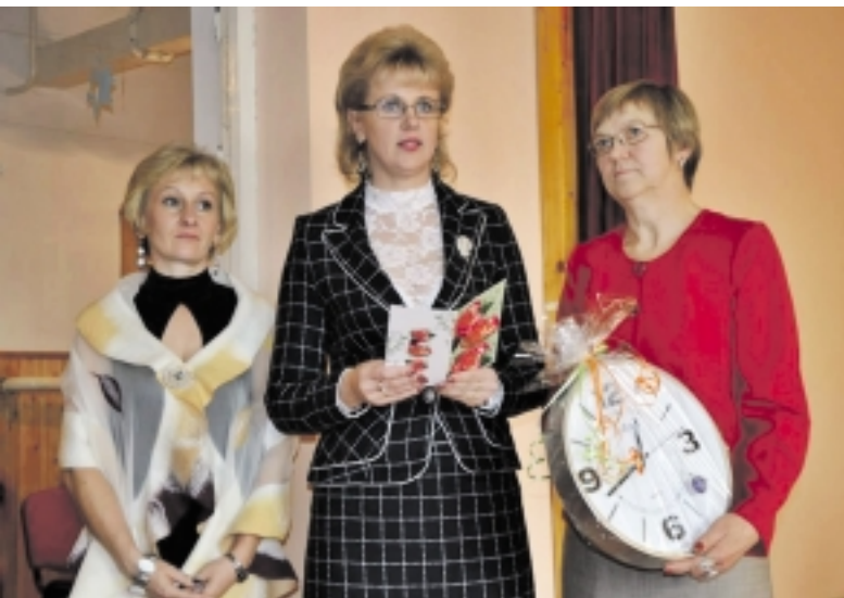
Sveikintojos iš Šylių.