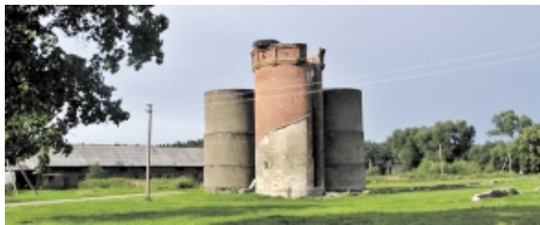
Iki šių dienų likę Šereitlauko dvaro statiniai – savito Rambyno regioninio parko kraštovaizdžio elementai.

Kitas teigiamas pokytis – lankytojams pritaikytas parko archeologinio paveldo vertybės: piliakalniai Vilkyškių, Opstainių ir Šereitlaukio kaimuose bei legendinis Rambynas, nuo kurio atsiveria puiki Nemuno, Ragainės bei Tilžės panorama. Rambyno regioninio parko kraštovaizdį pamažu gražina atnaujinamos sodybos, o ypač