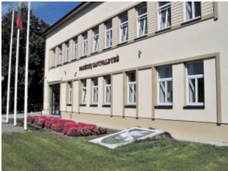
LLRI instituto vertinimu, Pagėgių savivaldybė gerina savo rodiklius.

Čia dar būtų galima pastebėti, kad per trejus metus labiausiai „krito“ Tauragės savivaldybės vertinimas: iš 2012 m. užimtos 13 vietos, 2013-aisiais ji nusileido į 21-ąją, o šiais metais „smuko“ į 47 poziciją iš 53 savivaldybių. Kai-