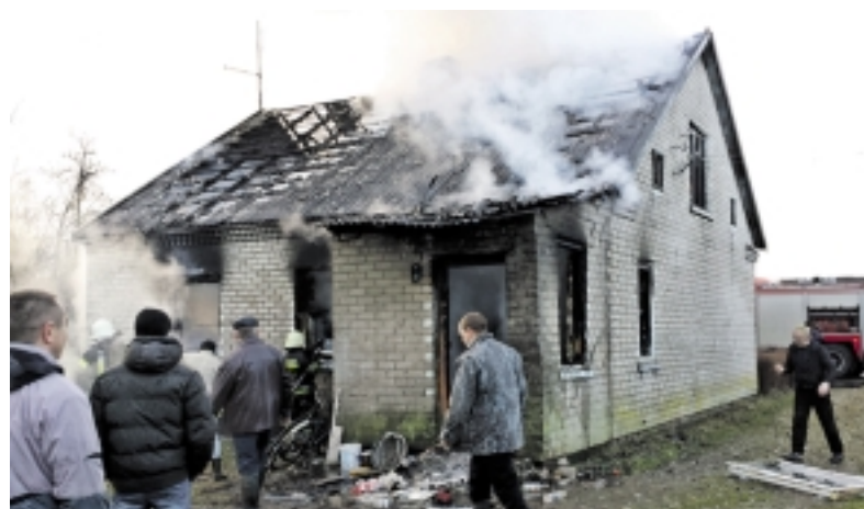
Kalėdų rytą Balčių k. esančiame name nutekėjo dujos ir įvyko sproginimas, kurio metu nukentėjo namo šeimininkai.

Praėjusių šventinę savaitę Šilutės priešgaisrinės gelbėjimo tarnybos ugniagesiai tris kartus skubėjo gesinti gaisrą. Į Traksėdžius skubėta du kartus, o štai Traksėdžių ir Balčių kaimuose gaisrai kilo dėl dujų balionų.