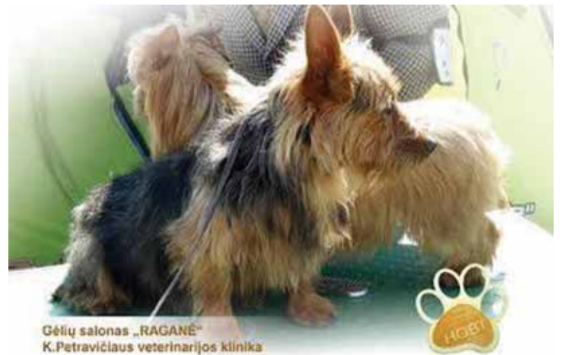
Gėlių salonas „RAGANĖ“ K. Petravičiaus veterinarijos klinika

* Granulinių ir kieto kuro katilų gamyba. Tel. 8 615 74 390.