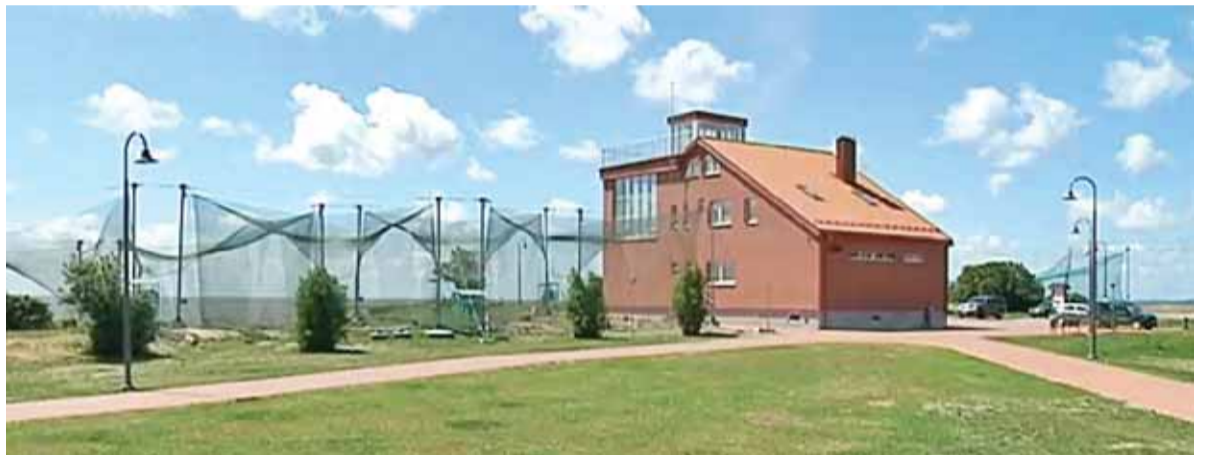
Užbaigus darbus lankytojus pasitiks nauja ornitologinės stoties infrastruktūra.

O dabar belieka laukti naujosios bei savo tradicijas išsaugojusios Ventės rago ornitologinės stoties įkurtuvių.