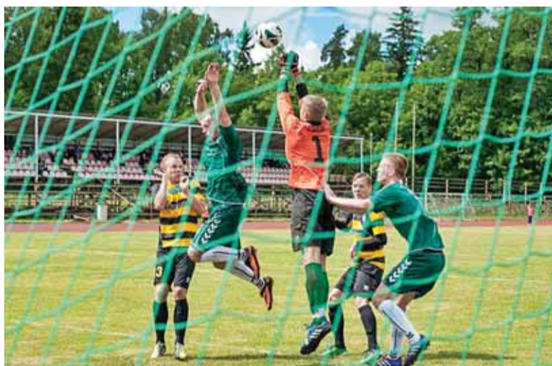
Ir be dviejų žaidėjų, gavusių raudonas korteles, „Šilutė“ ruošė ne vieną ataką į varžovų vartus.