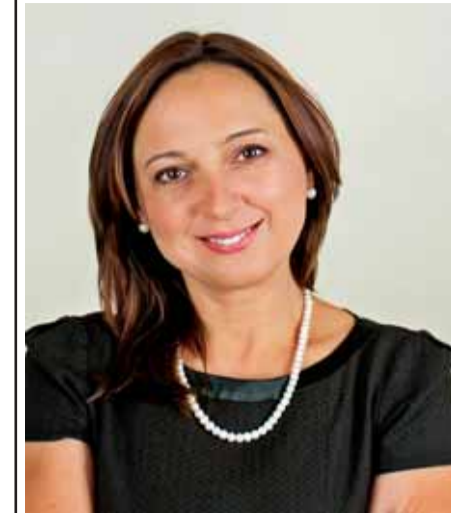
Politinė reklama. Apmokėta iš savarankiško politinės kampanijos dalyvio Šilutės rinkimų apygardoje Nr. 47, TS-LKD Šilutės skyriaus specialiosios rinkimų sąskaitos. Užs. Nr. 0623-3

Po tris mandatus Taryboje turės Lietuvos laisvės sąjunga (liberalai) ir Tėvynės sąjunga – Lietu-