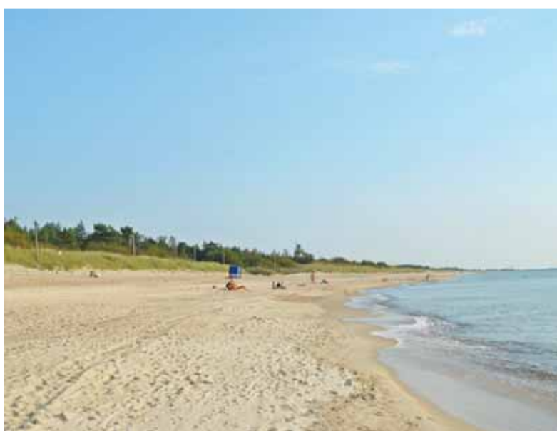
Uraganų nuplaukami ir vis siauresni smėlio paplūdimiai prie Baltijos jūros yra klimato kaitos padarinių pasekmė.

Prieš išeinant iš kambario išjunkime visus galimus elektros prietaisus – šviesas, televizorių, kompiuterį. Visi prietaisai, neišjungti