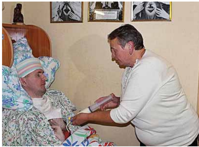
Motina sūnų maitina per vamzdelį suleidama maistą į skrandį.

Motina kas dvi valandas ruošia sūnui maistą – per vamzdelį suleidžia į skrandį iš miltelių pagamintos maistingos tyrės arba sutrinto maisto. Nors supranta, jog skrandis neįsijaučia skonio, kartais sūnų lepina ištirpdyta chalva ar šokolada.