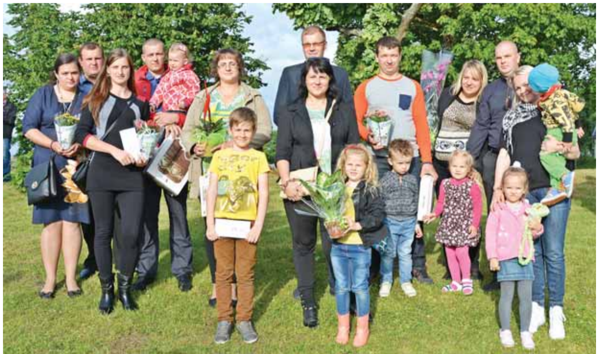
Šventės metu buvo apdovanota dešimt Vainute savo gyvenimą sukūrusių jaunų šeimų.

Kad netrūktų geros nuotaikos ir susirinkusieji galėtų smagiai