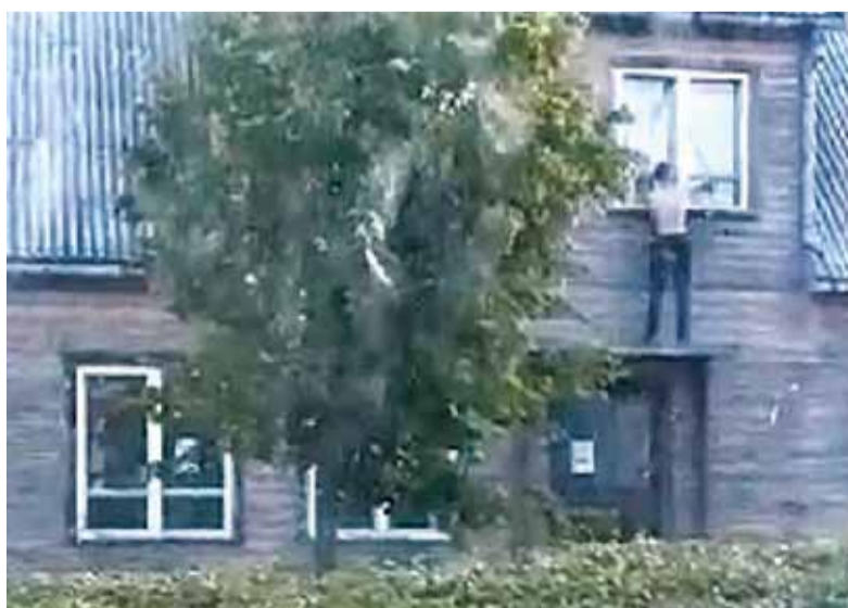
Sekmadienį, apie 6 val. ryto, Žemaičių Naumiestyje jaunuolis, užlipęs ant stogo, daužė langus. Atvykus pareigūnams ir medikams jis nukrito nuo stogo.

pažiūrėti, kas dedasi. Žinokit, nustėrau. Pusnuogis jaunuolis, užsikabarojęs ant negyvenamo namo verandos stogelio plikomis rankomis daužė stiklus. Puoliau filmuoti mobiliuoju telefonu, bet gerai, jog padariau tik trumpą įrašą, nes to, kas vyko toliau, manau, ištikta šoko jau nebebūčiau nufilmavusi. Jam bedaužant lango stiklą, didelė, kardo formos šukė įsirėžė giliai į ranką. Jis tą šukę išsitraukė pats, o tada pasipylė kraujo fontanai“, - susijaudinusi pasakojo naumiestiškę. Pasak redakciją užsukusios Laisvės gatvės gyventojos, jaunuolis, išsitraukęs įstrigusią šukę, prisėdo ant stogelio. Praėjus kuriam laikui, tikriausiai, kai pasidarė silpna dėl smarkaus kraujavimo, jis sukniubo. „Tada puoliau skambinti antrą kartą medikams. Tai man dar paaiškino, jog netei-