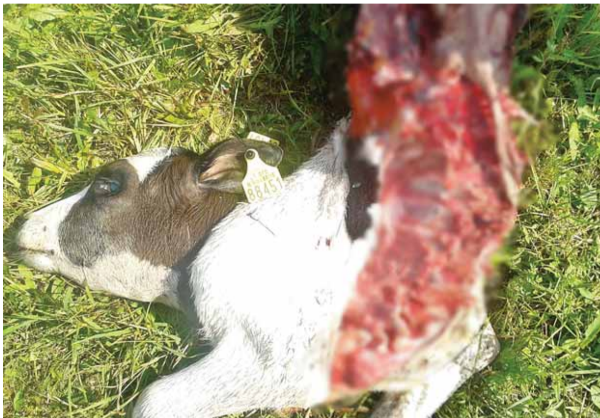
Vilkai, išvertę veršelių vidurius, paėdė sočiai...