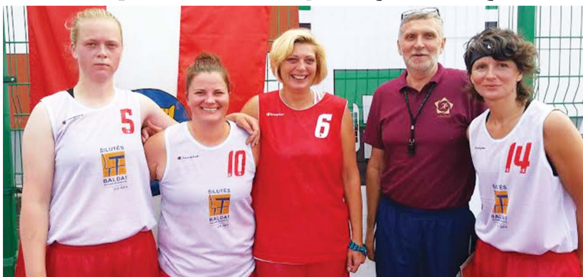
Moterų krepšinio komanda seniūnijų sporto žaidynėse ne naujokė. 2015 metų finale Utenoje taip pat dalyvaus.

Šeštadienį į Gargždus pasivaržyti įvairiose sporto rungtyse atvyko stipriausios 8-ųjų Lietuvos seniūnijų sporto žaidynių II etapo komandos iš Klaipėdos miesto bei rajono, Kretingos, Neringos, Palangos, Rietavo, Skuodo ir, žinoma, Šilutės. Varžytis tarp stipriausių ir bandyti iškovoti kelialapį į seniūnijų finalą, kuris vyks rugsėjo 19 dieną Utenoje, komandos įgijo iškovodamas pirmas vietas 1-ajame sporto žaidynių etape. Primename, kad žaidynės yra vykdomos trimis etapais: pirmasis prasideda savivaldybėse, į antrąjį etapą patenka stipriausios savivaldybių seniūnijų komandos, kurios kovoja su kitomis savivaldybėmis dėl patekimo į finalą.