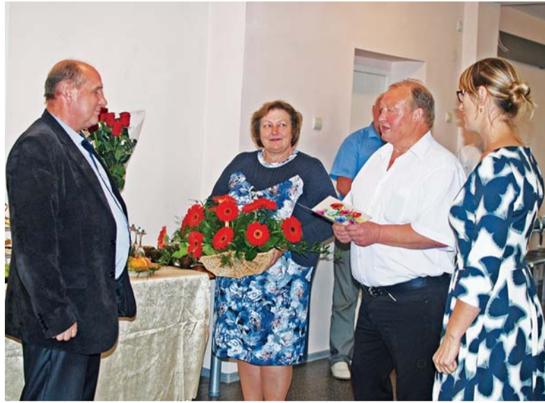
Gražiausių linkėjimų puokštę įteikė naumiestiškiečiai.