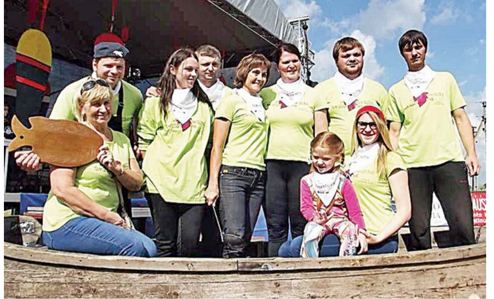
Žuvies sriubos konkurso trečiosios vietos laimėtoja tapo komanda, surinkusi 105 taškus - „Traksėdžių viltis“.

Pirmiausia paskelbti žuvies sriubos konkurso nugalėtojai. Trečiosios vietos laimėtoja tapo komanda, surinkusi 105 taškus - „Traksėdžių viltis“. Antroji vieta atiteko Šilutės miškų urėdijos komandai „Giriniai“, surinkusiai 117 taškų. Pirmąją vietą iškovoję komanda iš Latvijos Saldus miesto (121