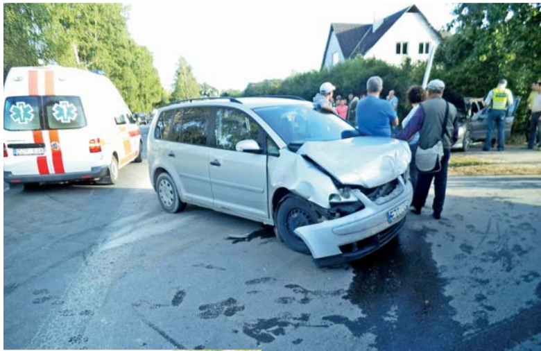
Ketvirtadienio vakarą Pagrynių kaime susidūrus „Peugeot 206“ ir „VW Touran“ nukentėjo trys žmonės.

Avarija įvyko, kai klevo lapu pažymėto automobilio „Peugeot