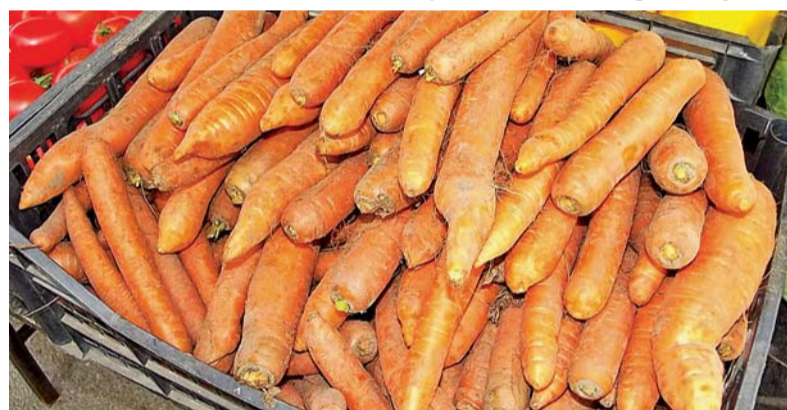
Šeštadienį Šilutės turgavietėje kilogramas morkų kainavo 0,4 arba 0,6 Eur.

Žemės ūkio informacijos ir kaimo verslo centro duomenimis, už kilogramą morkų supirkėjai dabar moka po 0,15–0,30Eur, o didžiuosiuose prekybos centruose praėjusią savaitę jos kainavo 0,75 Eur – kaina palyginti su tuo pačiu praėjusių metų laikotarpiu išaugo net