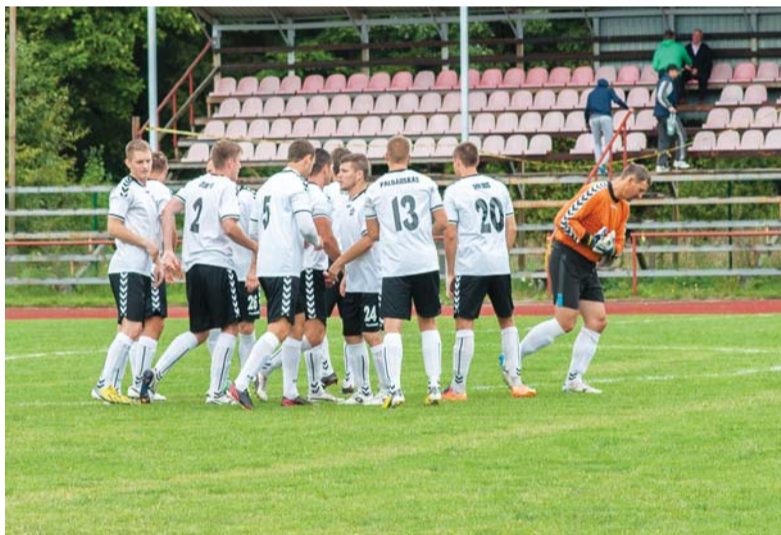
„Šilutė“ po 26 turo rungtynių yra devintoje turnyrinės lentelės vietoje (tarp 18 komandų).

žantė“), 90 min. Mantas Bialaglovas – geltona kortelė („Kražantė“).