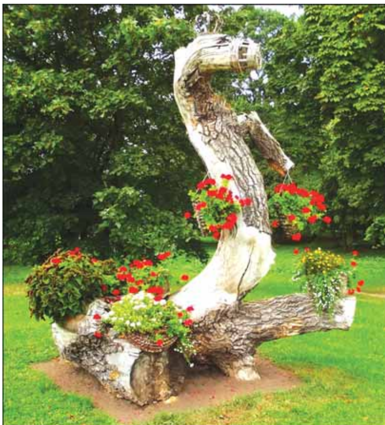
Panemunės parke puikuoja „drakonas“.