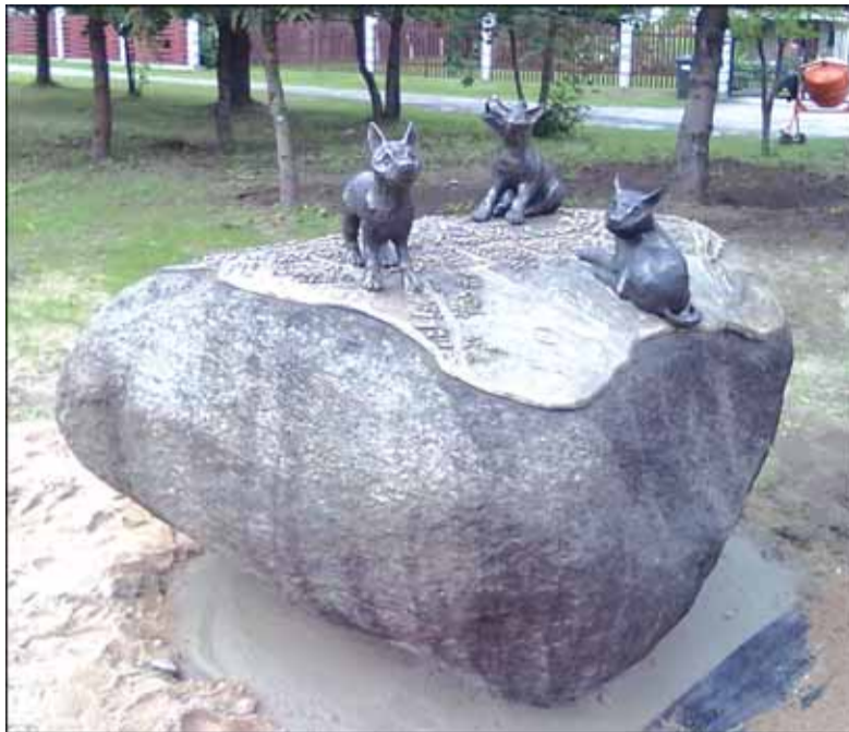
Rajono valdžia Vilkyčių gyventojams seniūnijos nusprenždė neduoti.