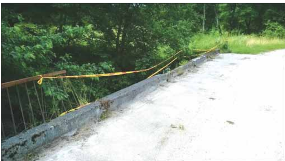
Tiltas prieš rekonstrukciją.