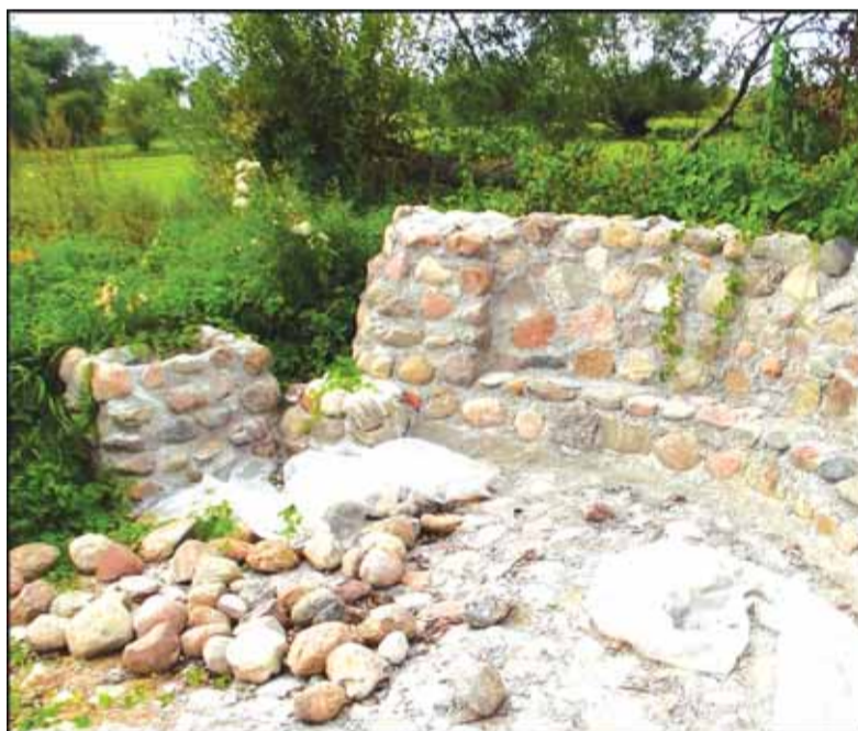
Būsimojoje maudymvietėje įrengiama poilsiavietė, sumūryta šašlykinė.