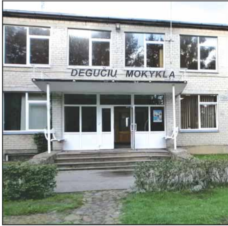
Pasiūlyta Žemaičių Naumiesčio gimnazijos Degučių skyriui priklausančiose patalpose įkurti Jaunimo socializacijos centrą.

„Nieką nesuprantu, kodėl Degučiuose? Kuo ta vieta ypatinga? Rajone nėra vienas kaimas nenorės tokio centro. Vėl kyla klausimas, o kur dės tuos likimo nu-