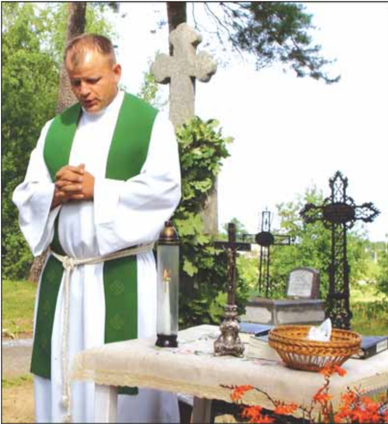
Akimirkos iš Laugalių kapinių tvarkymo.