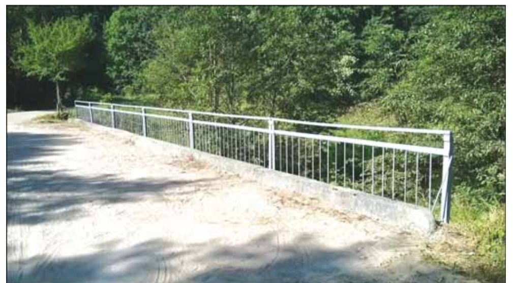
Po rekonstrukcijos tiltu vaikščioti saugu.

Dar liepą į „Šilokarčemos“ redakciją kreipėsi Saugų seniūnijos Barvų kaimo gyventojai, kurie tuomet nerimavo dėl tilto, einančio per Tenenio upę. Jis jungia Barvų ir Lapynų kaimus. Pasidomėjome, kokia situacija dabar – pasirūpino Saugų seniūnija žmonių saugumu ar ne?