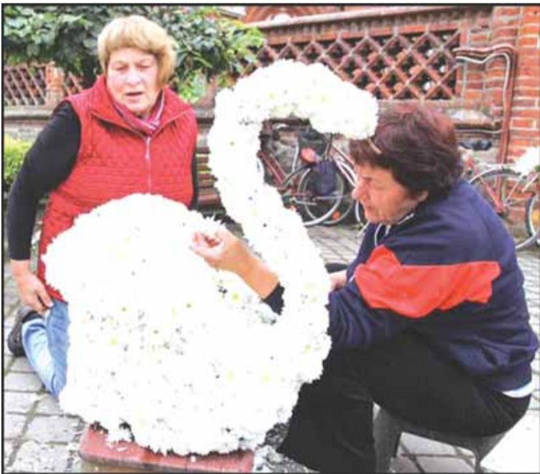
Draugijos narės mielai pynė gyvų gėlių kilimus.

Šilutės rajono neįgalių draugijos Švėkšnos padalinio nariai ir toliau savo iniciatyvomis, kurios jau tapo tradicija, džiugina švėkšniškius ir miestelio svečius. Ką jie sumanė šįkart?