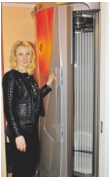
Salono „Luiza“ naujovė - vertikalus soliariumas, kuriame galima pasilepinti ir įgauti natūralų kūno įdegį.

talpos ir viskas padaryta taip, kad atėjusiems būtų jauku. Ypač tai jaučia moterys, kurios gali pasirinkti Pagėgių mieste esančias naujoves - tai vertikalus soliariumą, kuriame galima pasilepinti ir įgauti natūralaus kūno įdegį. Puikaus dizaino itin patogus „Megasun“ soliariumas, kuriame deginamasi stovint. Jame galima laisvai judėti, todėl įdegama tolygiau. O aquaCool (dulksna) ir aroma (aromaterapija) užtikrins gaivų deginimąsi ir ozono kvapo neutralizavimą.