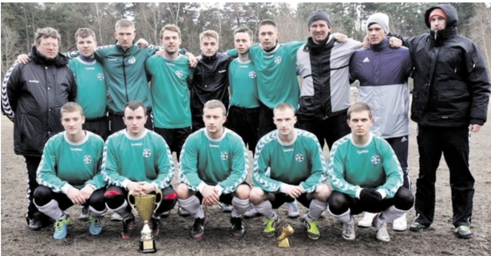
Futbolo komanda „Šilutė”, „Palangos Juzėje” iškovojo II vietą.

Tradicioniame ir giliausias tradicijas šalyje turinčiame tarptautiniame futbolo turnyre „Palangos Juzė” dalyvavo ir garbingą antrąją vietą - nusileidusi tik Lietuvos jaunimo U-18 ((1996 m. gimimo ir jaunesni žaidėjai) rinkitinei - iškovojo FK „Šilutė”.