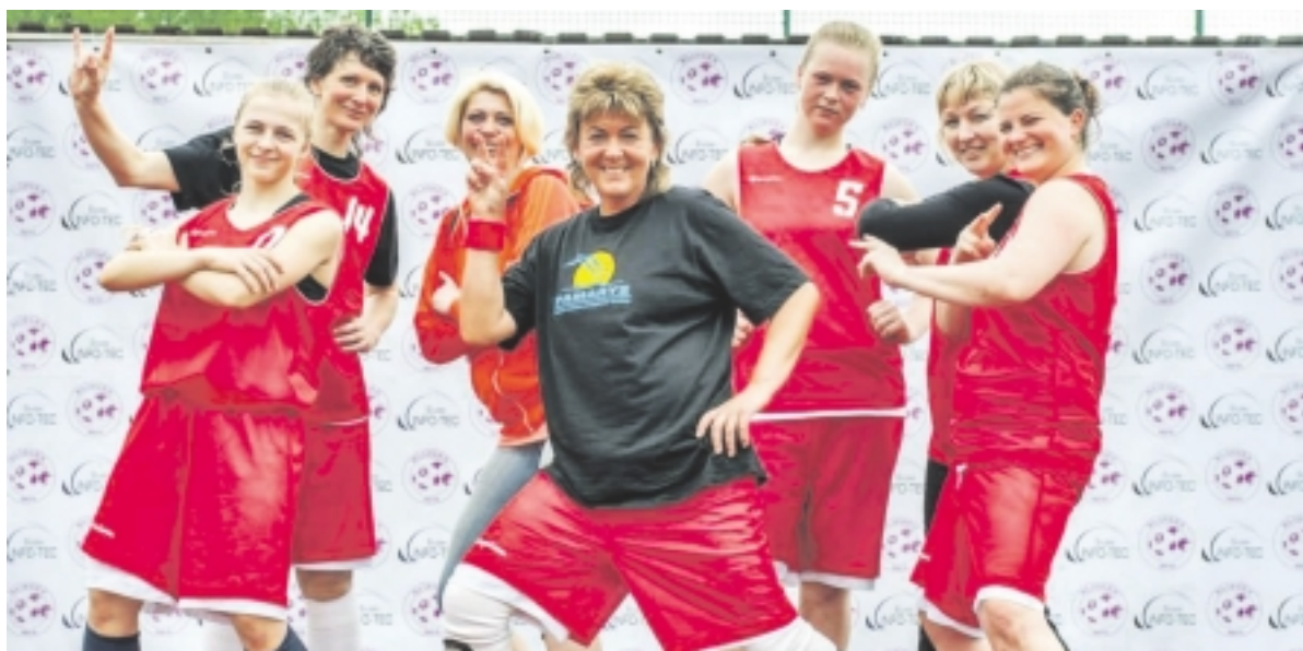
Krepšinio komandos „Pamarys“ narės aktyvios ne tik krepšinio aikštelėje, bet noriai dalyvauja ir kitose rajone organizuojamuose sporto renginiuose.

Baigėsi Lietuvos moterų krepšinio „A“ lygos čempionatas, kuriame šilutiškės „Pamario“ krepšininkės užėmė garbingą IV vietą. Vilniuje vykusiuose finaluose joms nepavyko įveikti varžovių bei iškovoti medalio, tačiau kaip pasakojo merginos, „būti čempionate ketvirtoms – iššūkis ir didžiulė pergalė, prisiminus, su kokiomis komandomis teko susitikti ir kovoti“.