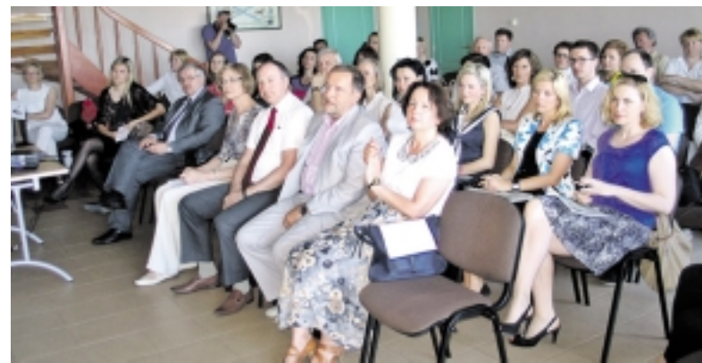
Konferencijos „Ventainėje“ dalyviai.

Kalendoriuje – ne tik būsiami renginiai, bet paspaudus atgalinę rodyklę galima patekti į ankstesnį mėnesį (ar mėnesius) ir prisiminti, kas, kur ir kada vyko – taip atskleidžia visa renginių panorama. Ateityje šis kultūros renginių kalendorius bus dar labiau tobulinamas.