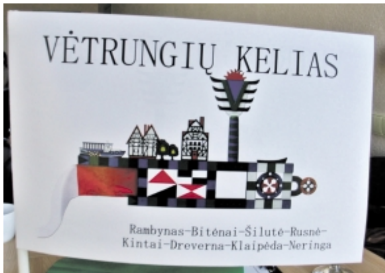
Projekto „Vėtrungių kelias“ ženklas.

Anot J. Pancerovos, šio projekto rengėjai ir partneriai buvo užtikrinti finansavimu, todėl labai nušėbo, jog pasikeitus Kultūros ministerijos politikai, lėšas panašioms projektams imta skirstyti per Lietuvos kultūros Tarybą. O toji turimas lėšas, užuot pagrindinį dėmesį skyrusi darbų tęstinumui ir koncentravusi į visai šaliai svarbius