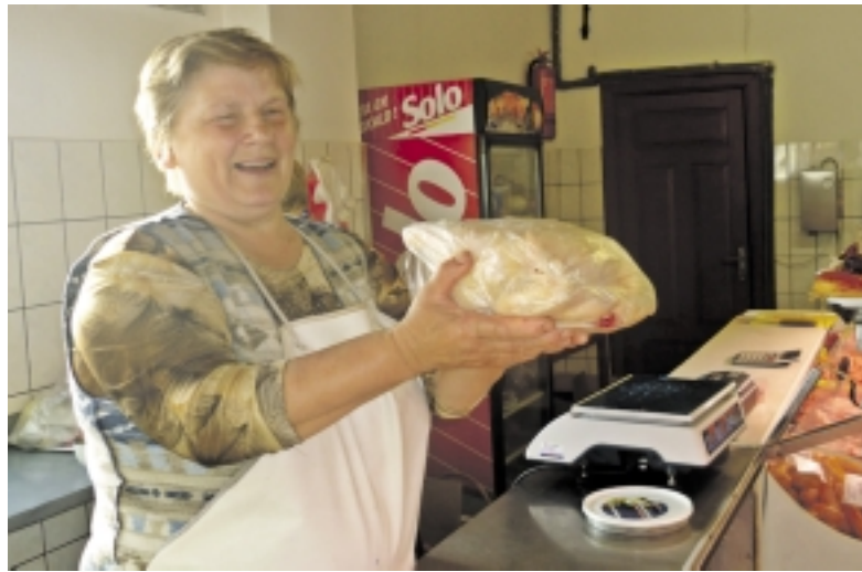
Juknaitiškė M. Leonavičienė už broilerių kilogramą prašė po 16 litų, o vienas toks paukštis svėrė po 2,5 kg ir dar daugiau.