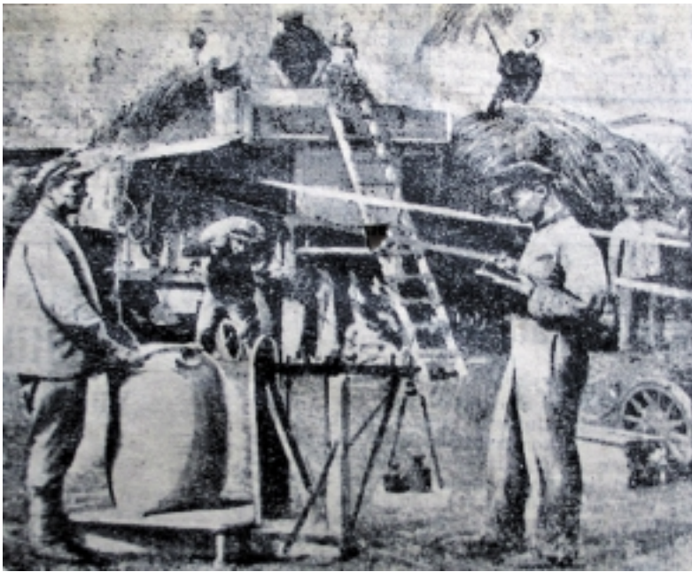
Pokaryje visoje Lietuvos TSR, o taip pat ir Klaipėdos krašte, prasidėjo naujos socialistinės visuomenės kūrimas.

Tik 1947 m. balandžio 30 d. Lietuvos SSR AT Prezidiumas kreipėsi į SSRS AT Prezidiumą dėl SSRS pilietybės suteikimo istorinio Klaipėdos krašto gyventojams, lietuviams. Atitinkamą įsaką SSRS AT Prezidiumas priėmė 1947 m. gruodžio 16 d. Esant tokiai padėčiai beveik trejus metus po krašto „išvadavimo“ vietos gyventojai neturėjo lygių pilietinių teisių su atvykėliais ir buvo diskriminuojami tiek naujos valdžios atstovų, tiek naujakurių. Todėl Lietuvos SSR vietinės valdžios or-